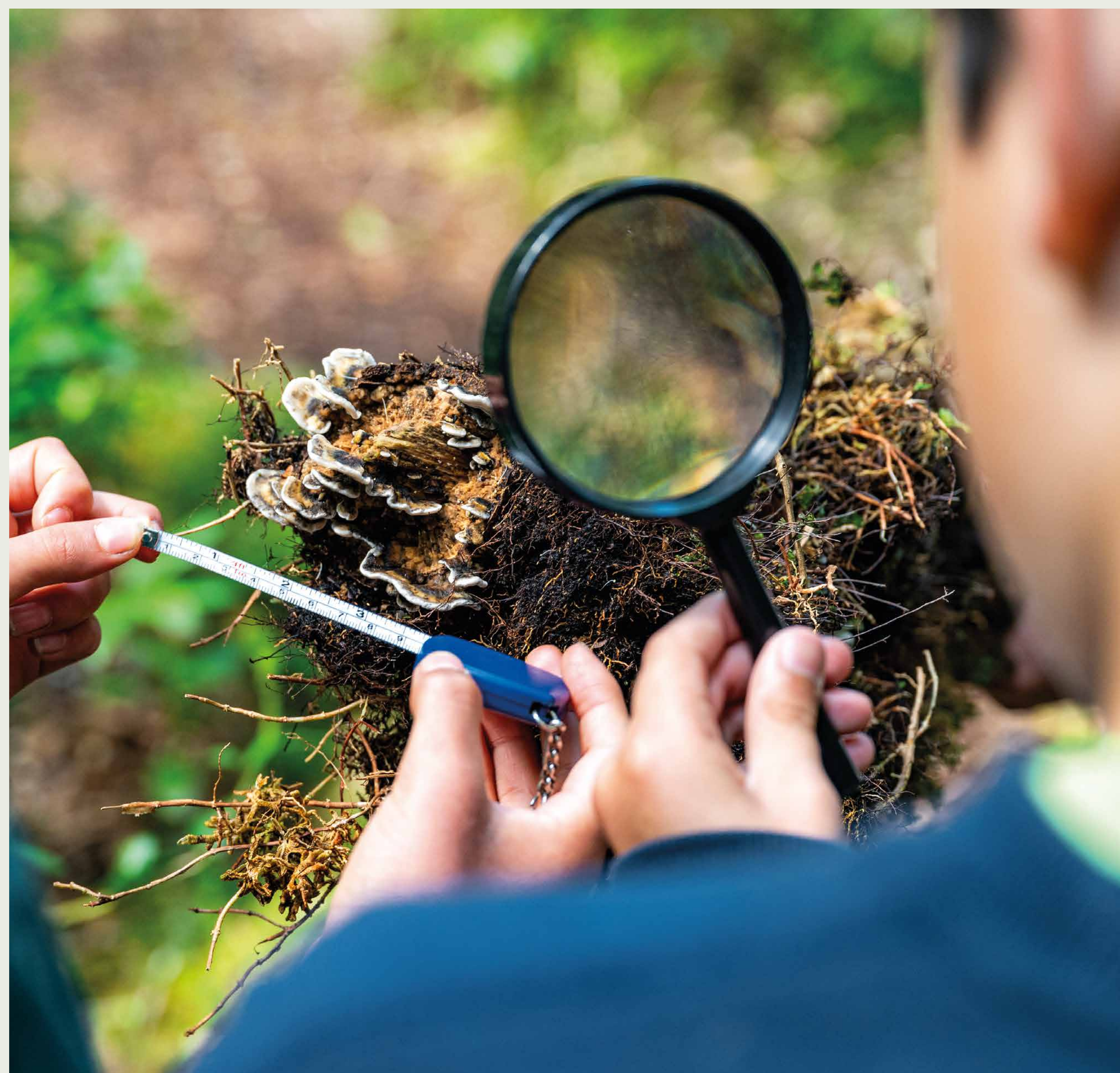
CONSERVACIÓN Y CIENCIA